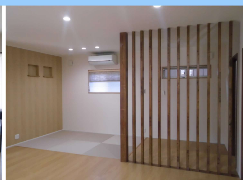
IKEDA HOME 住まいの相談受付中